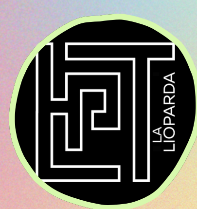
La Lioparda Teatre