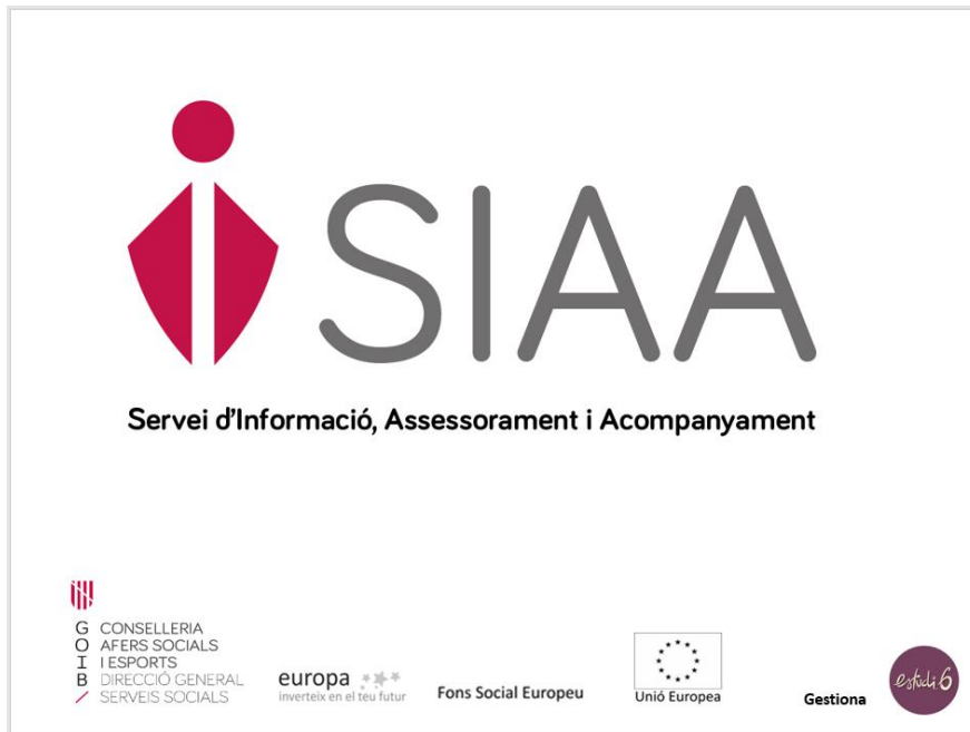
Il·lustració 6: Portada del Powerpoint mostrada en las reuniones formativas sobre el SIAA.

Por todo lo anterior, esta actuación presenta una estrategia de difusión adecuada que cumple con los requisitos preceptivos en materia de comunicación del Fondo basada en: mesas informativas con profesionales, recursos y entidades; sesiones grupales informativas con participantes; sesiones individuales informativas; carteles divulgativos para entidades y usuarias en papel; trípticos informativos; difusión del servicio vía correo electrónico y difusión en las RRSS de las entidades con las que están coordinados.