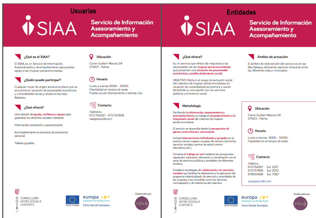
Ilustración 4: Material informativo dirigido a las posibles beneficiarias y a los/as profesionales.