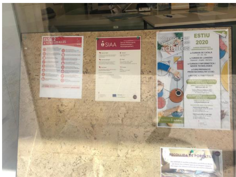
Ilustración 5: Difusión de SIAA en la sede de Estudi 6 Gestió Socioeducativa, S.L.