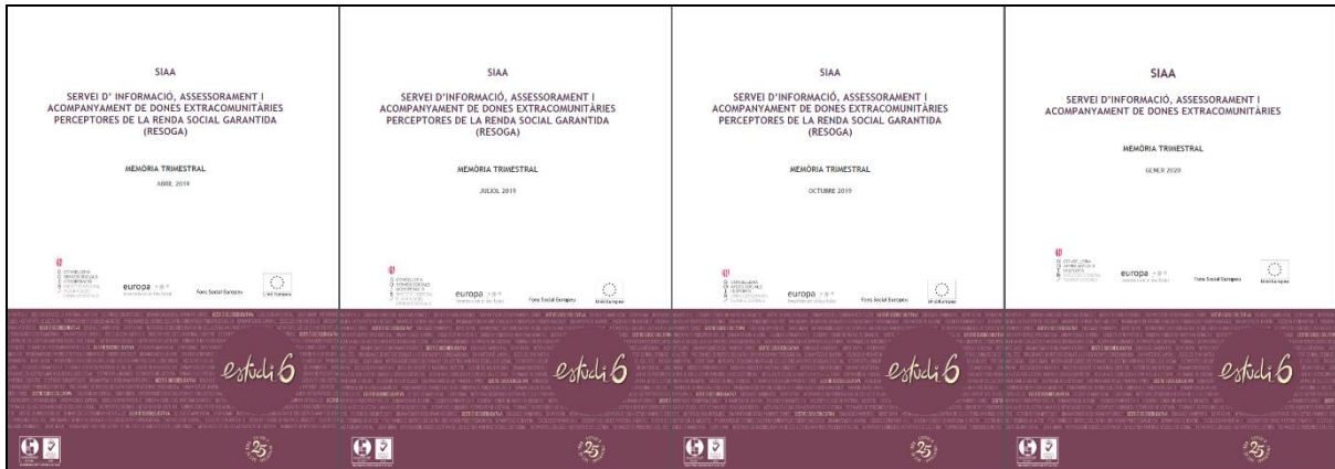
Ilustración 3: Memorias trimestrales de SIAA hechas por Estudio 6.

En ellas se muestra la evolución de la actividad, su desarrollo y la valoración del impacto del programa en sí. Se visibiliza la tipología de mujer beneficiaria del servicio, los resultados obtenidos anteriormente en las diversas actuaciones realizadas y las atenciones que se ofrecen desde el SIAA según la tipología de demanda/necesidad que presentan las personas participantes.